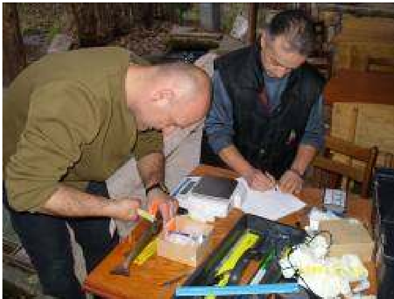
Маркирање и мерење на рибите

Основната идеја на проектот Заштита, ревитализација и реинтродукција на македонска речна пастрма ( Salmo Macedonicus Karaman 1924) во водите на Република Македонија беше спречување македонската пастрмка целосно да исчезне. Затоа беше потребно да се превземат чекори за заштита на нашето природно богатство и да се направи конкретна акција со цел намалување на причините и зголемување на бројноста на популацијата на македонската речна пастрмка и истата да се реинтродуцира во водите каде некогаш живеела.