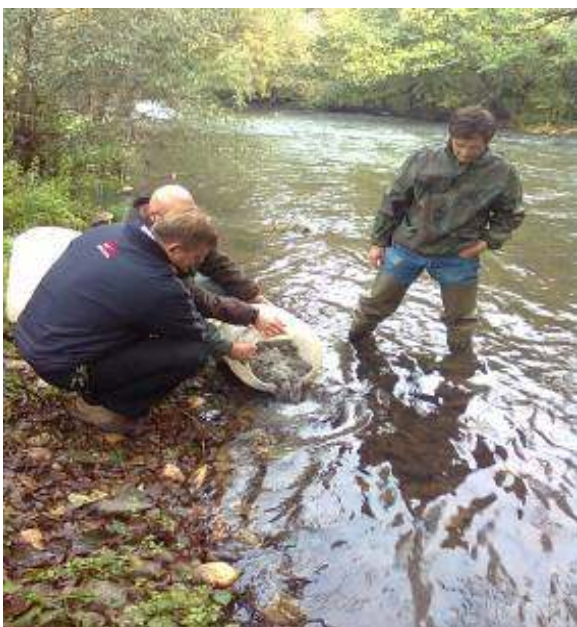
Порибување на реката Треска

Во текот на 12-те месеци, колку што траеше проектот, реализирани се следниве активности: изловени се матици, формирано е матично јато, извршен е вештачки мрест и добиени се приближно 20.000 единки со кои се порибени води во кои постоеше реална опасност еден автохтон вид на риба, Salmo Macedonicus (Karaman, 1924) да исчезне.