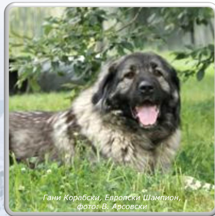
Гани Корабски, Европски Шампион, фото: В. Арсовски

КАРАКТЕРИЗАЦИЈА НА БИОЛОШКАТА РАЗНОВИДНОСТ НА ШАРПЛАНИНЕЦОТ, НЕГОВА ДИСПЕРЗИЈА И РЕИНТРОДУКЦИЈА ВО РУРАЛНИ ПОДРАЧЈА И ОДГЛЕДУВАЧИ НА РАСАТА – РЕПЛИКАЦИЈА